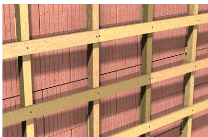
Sottostrutture in legno