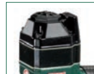
Versione A - A model